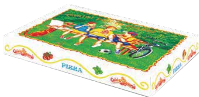
IMMAGINE E DISEGNO TECNICO